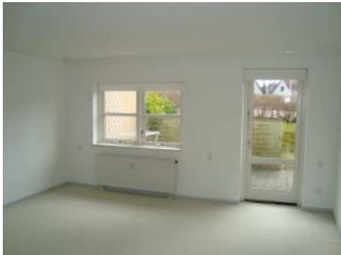
Stue (NB der er parketgulv under tæppet)

Ønsker du at se plantegninger over din og de øvrige boliger i afdelingen, finder du dem i bilaget PLANTEGNINGER.